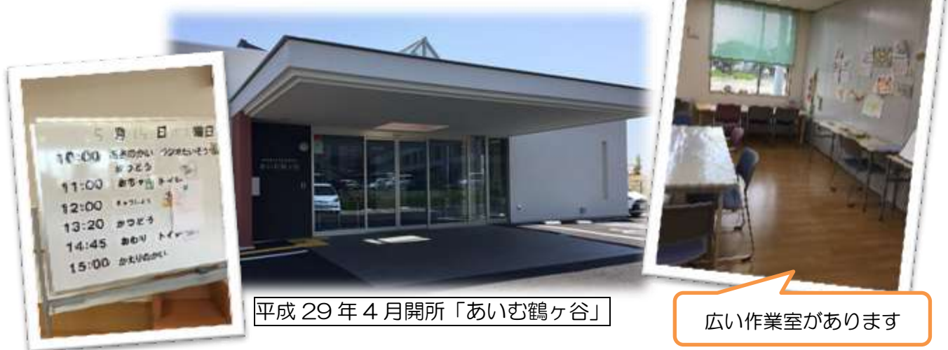
平成29年4月開所「あいむ鶴ヶ谷」

活動内容：創作班とリサイクル班（シュレッダー作業）に分かれての活動、 全体レクリエーション、余暇活動など