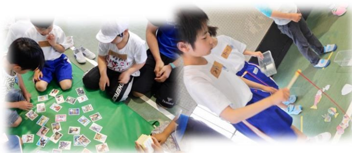
【16日 丘小のみんなと遊びました】