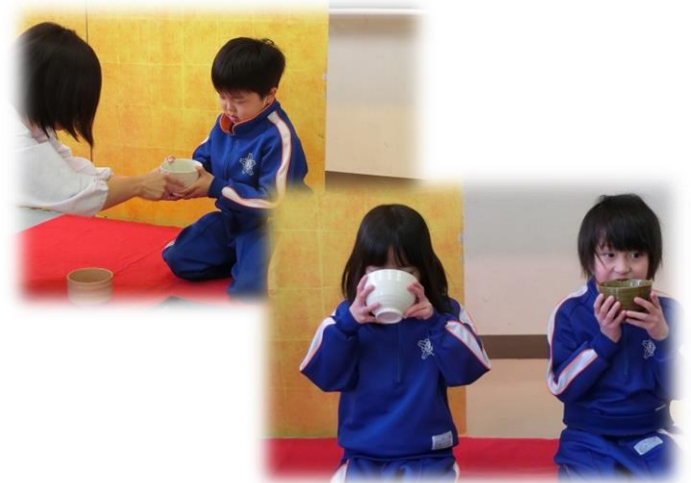
<ちょっと苦がいかも…初釜>