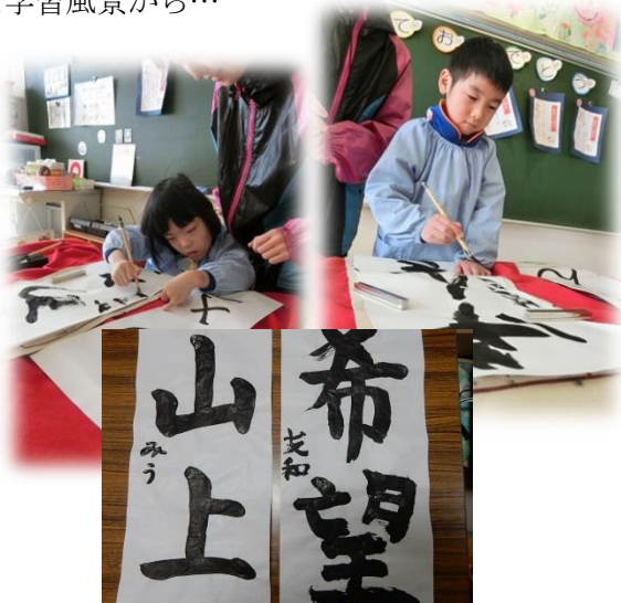
<心を込めて書き初め>