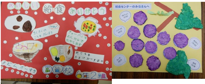
<富谷校からの感謝のメッセージ>

富谷市の給食センターの栄養士や調理員の皆様には、富谷校全員からの感謝のメッセージをお届けする予定です。センターの皆様、いつも細やかな心配りをいただきながらおいしい給食を用意いただきありがとうございます。これからもどうぞよろしくお願ひします。